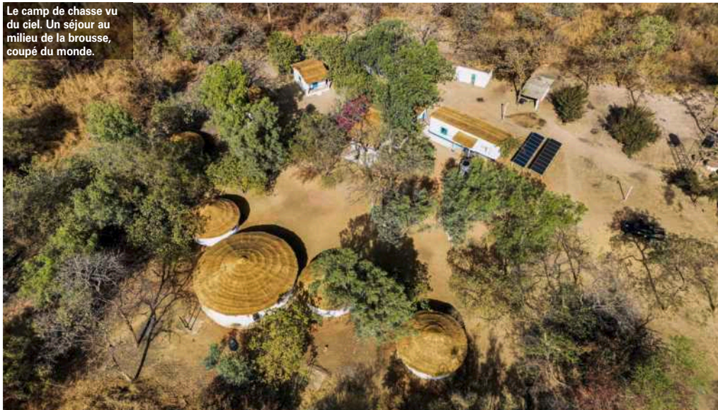
Le camp de chasse vu du ciel. Un séjour au milieu de la brousse, coupé du monde.