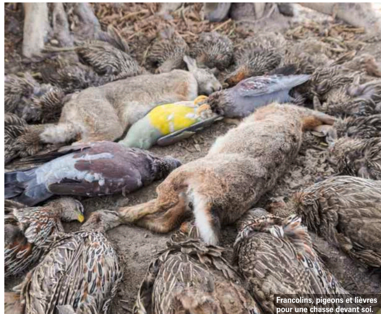
Francolins, pigeons et lièvres pour une chasse devant soi.