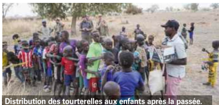
Distribution des tourterelles aux enfants après la passée.