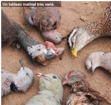
Un tableau matinal très varié.