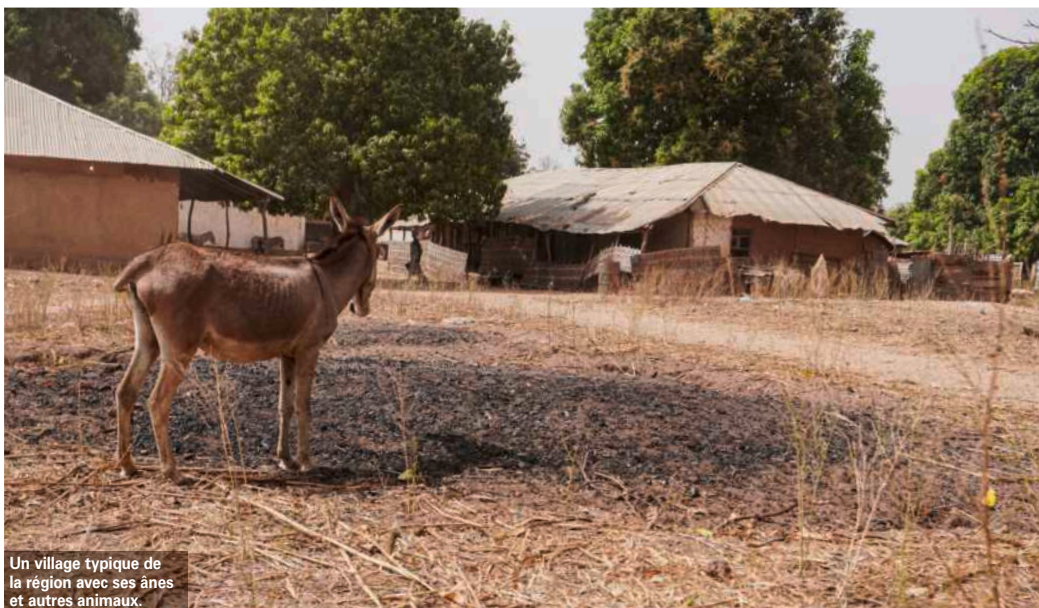
Un village typique de la région avec ses ânes et autres animaux.