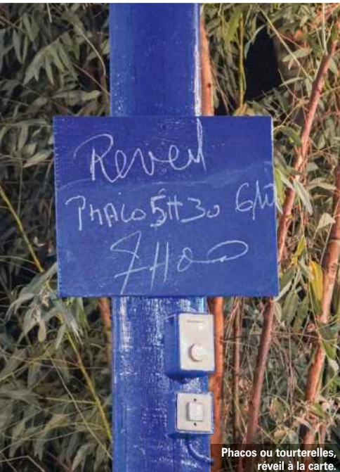
Phacos ou tourterelles, réveil à la carte.

“ Récolte d'un soir, partagée avec plaisir. La chasse est un cadeau du ciel pour les familles des villages alentour. ”