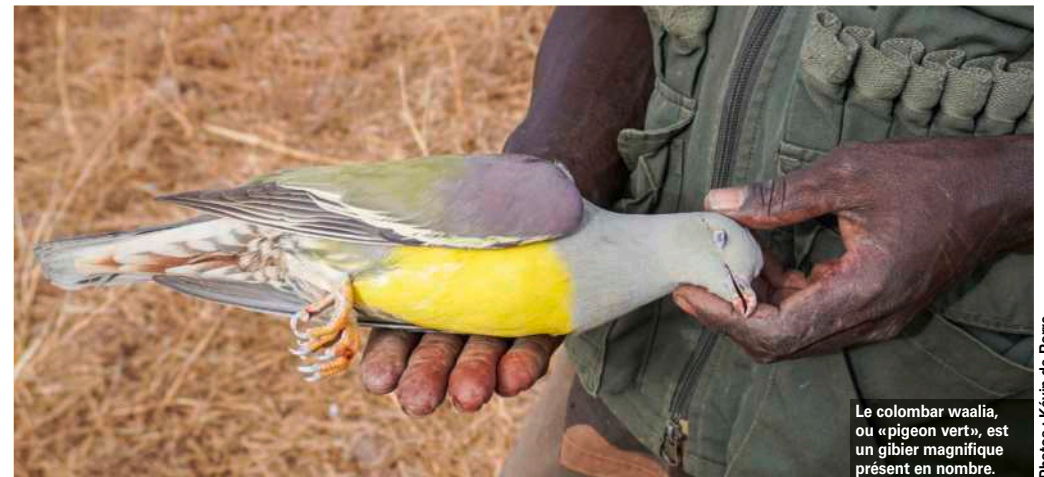
Le colombar waalia, ou « pigeon vert », est un gibier magnifique présent en nombre.