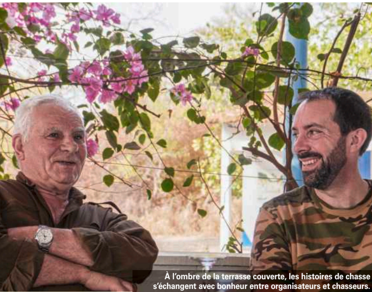
À l'ombre de la terrasse couverte, les histoires de chasse s'échangent avec bonheur entre organisateurs et chasseurs.