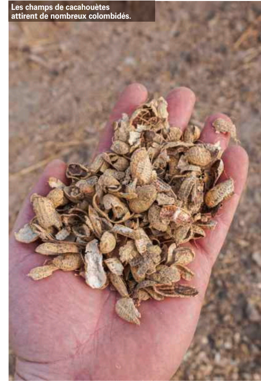
Les champs de cacaahuètes attirent de nombreux colombidés.