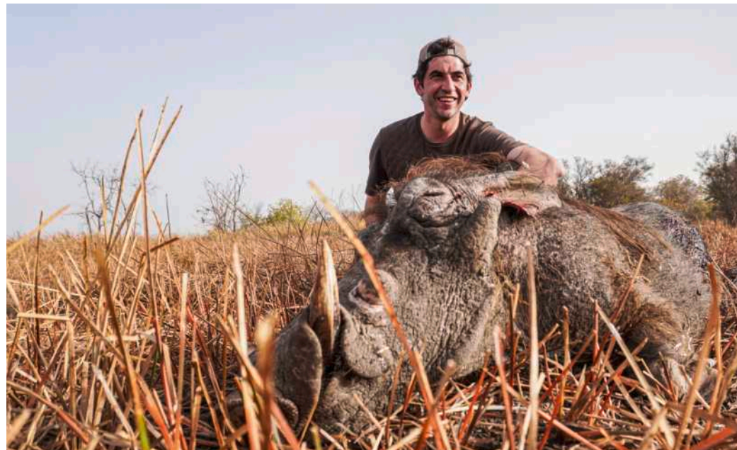
Contact : DHD LAIKA - 01 42 89 32 64 - info@dhdlaika.com