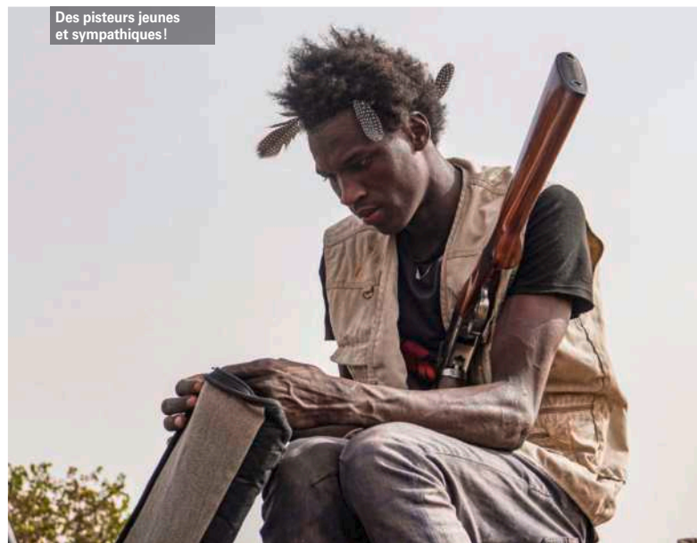
Des pisteurs jeunes et sympathiques!