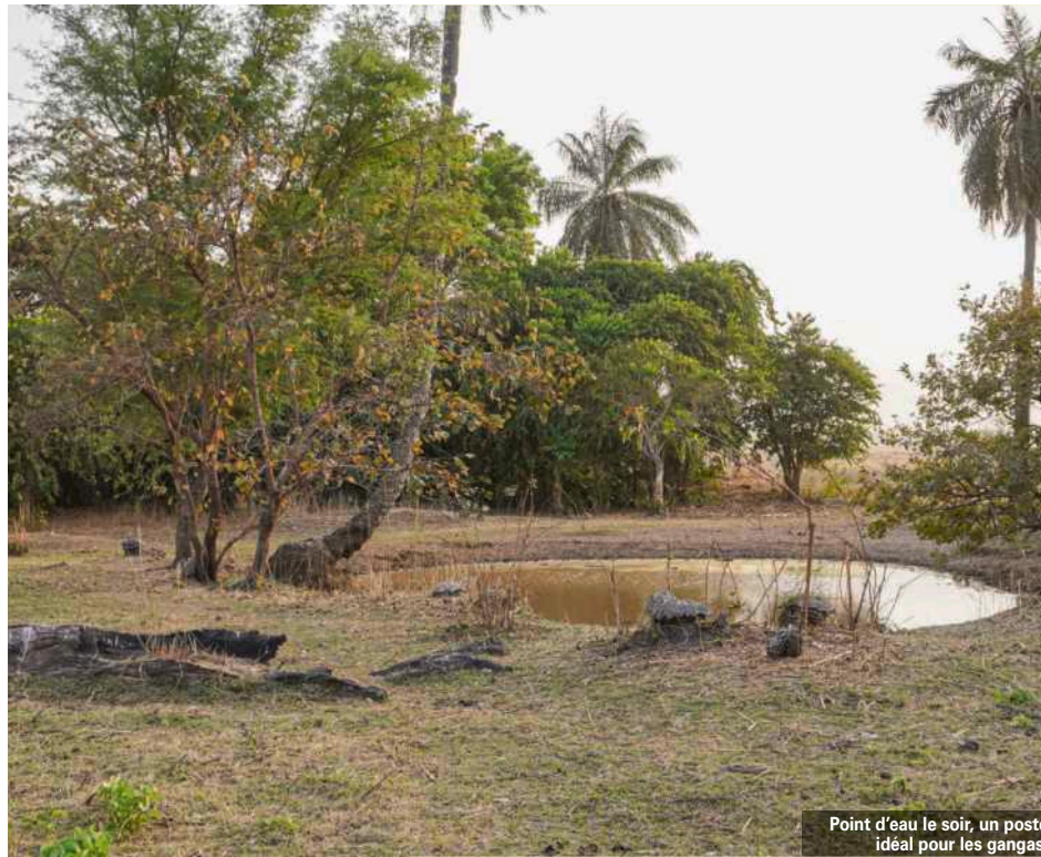
Point d'eau le soir, un poste idéal pour les gangs.