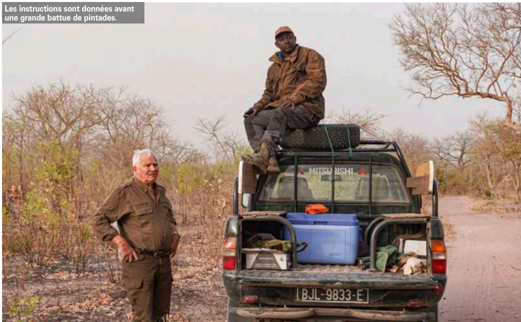
Les instructions sont données avant une grande battue de pintades.