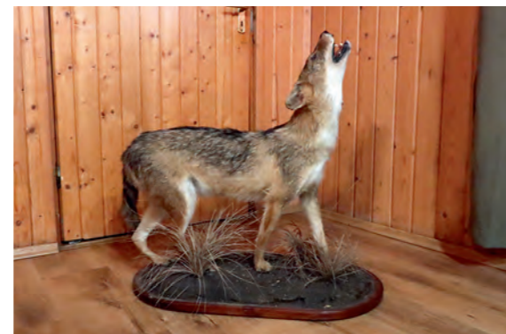
Le chacal doré, en expansion, complète la liste des gibiers de la battue.

(altitude moyenne de 100-200 m) où se porte à merveille le grand gibier : sangliers, chevreuils, cerfs voire daims. Les animaux profitant tour à tour des bienfaits du bois comme de la plaine. Les territoires appartiennent soit à l'État, soit à des clubs privés, sachant que la chasse en forêt domaniale offre de plus grandes unités forestières tandis que les clubs gèrent des territoires davantage morcelés, relevant un peu de la mosaïque. Offrant des densités d'animaux un peu supérieures, la chasse en forêt d'État est plus chère de 20%. Enfin, certains de ces territoires publics comme privés accueillent des enclos. À deux heures de route de Budapest, au sud-ouest du lac Balaton, nous rejoignons l'un des secteurs où officie Dhd-Laïka. Mathieu Breton,