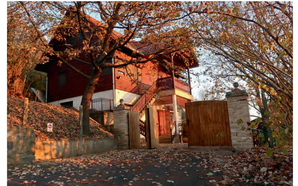
Un réceptif parfait, qui se caractérise notamment par une cuisine réellement gastronomique.

oublier l'éventuelle rigueur hivernale. N'économisez pas sur votre budget isolation ; les vêtements chauffants seront les bienvenus. Au poste, l'attente peut se révéler fort longue tandis que souffle un vent venu de l'Est. Certes, la forêt respire en ce mois de décembre, le ciel est d'un bleu pur, et pour cause, mais l'attention peut se trouver perturbée par un vent quasi sibérien. Parfois, le froid est humide, s'enrichissant généreusement d'un grésil non moins « stimulant ». Joies de la chasse. Autre équipement pratique, un siège de battue se révélera très utile au poste au sol, voire au mirador. La tenue vestimentaire compte d'autant plus que Mathieu recommande de venir chasser en