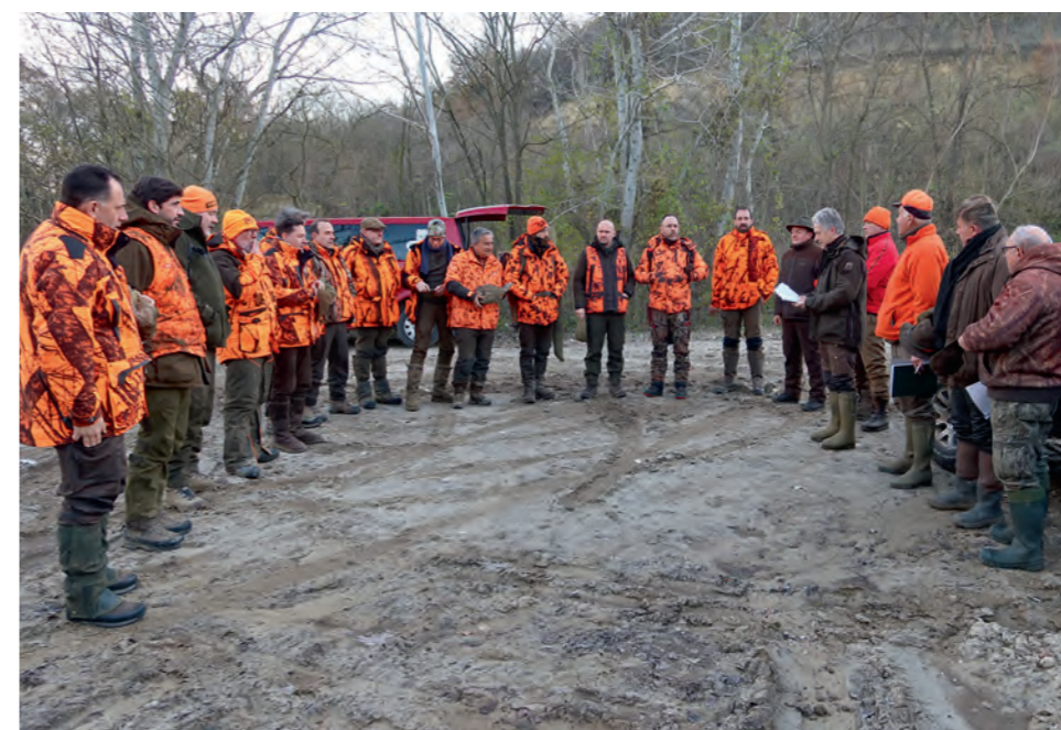
Le traditionnel et indispensable rond conditionne le chasseur et le prépare à vivre une journée sans mauvaise surprise. Restera à demeurer concentré sur les bruits et mouvements furtifs du sous-bois.

des forêts. Et puis, au milieu de cette moitié ouest du pays, s'étend le lac Balaton. Il s'agit du plus grand lac naturel d'eau douce d'Europe centrale et occidentale : 78 km de long, jusqu'à 15 km de large. Pour comparaison, sa superficie est de 592 km 2 , contre 235 pour le lac Léman et... 45 km 2 pour le lac du Bourget, plus grand lac de France. Au fil des 197 km de rives, sur une eau dont la profondeur moyenne est de 3,20 m (maximum 12,5 m), on affûte les canards. En plaine, les faisans s'ajoutent aux becs plats.